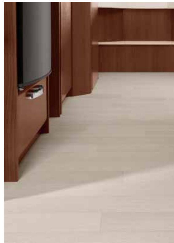
Milk (Empfehlung für Wohnwelt „Classic“)