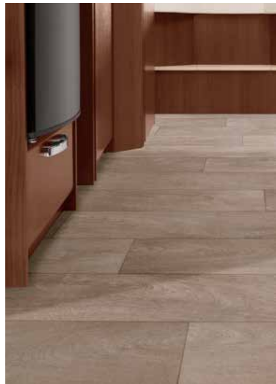
Cappuccino (Empfehlung für Wohnwelt „Style“)