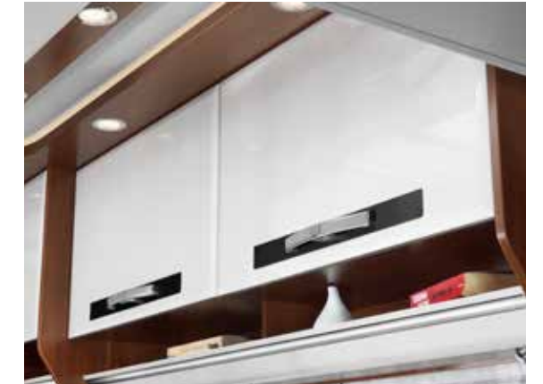
Oberschränke in Wohnwelt „Style“