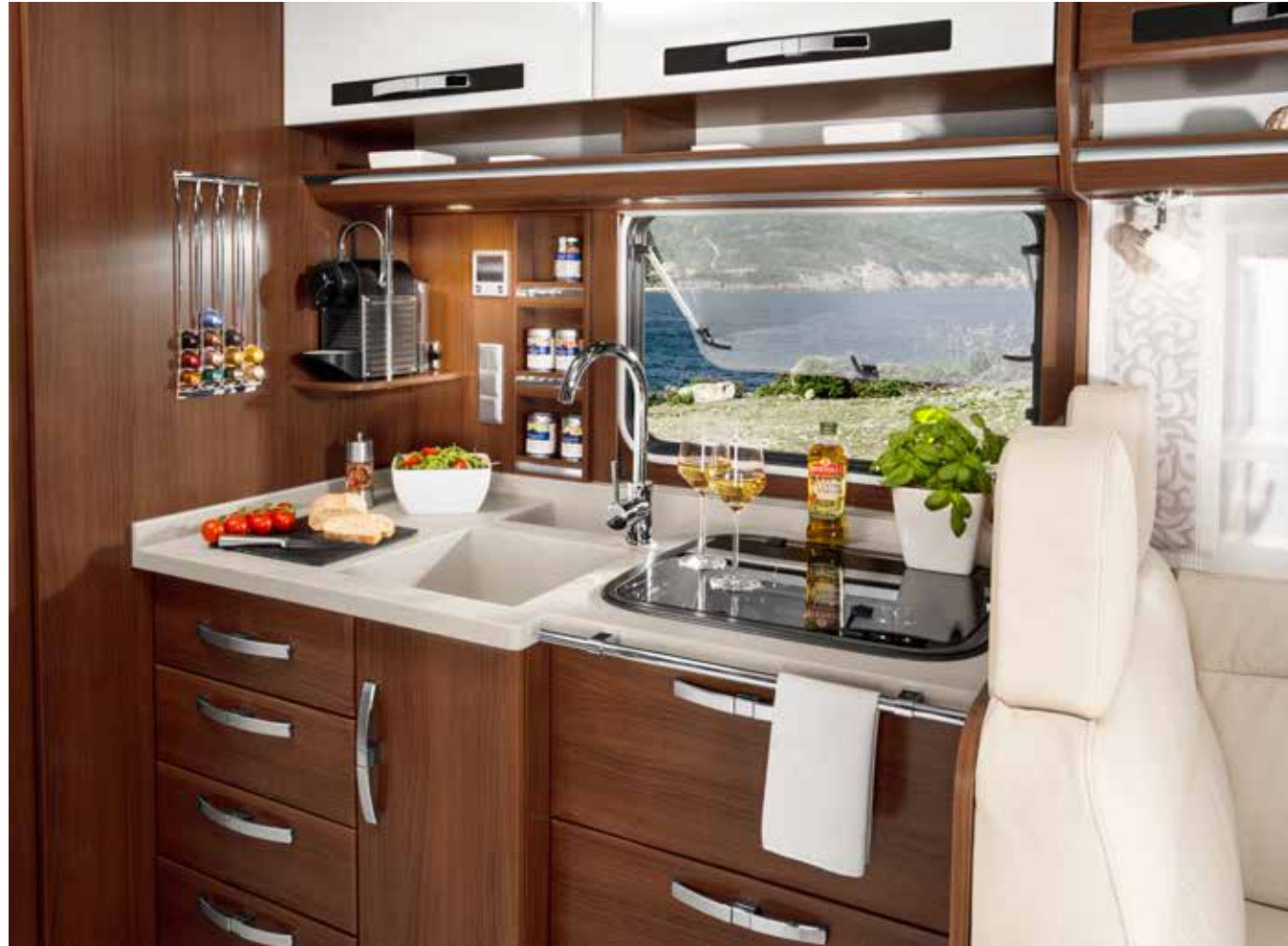
Küchenblock in Wohnwelt „Classic“

Empfehlung: Fußboden: „Milk“, Küchenarbeitsplatte: Mineralwerkstoff „Salt“, Tischplatte: „Kupfer“, Polster: Leder „Malibu“.