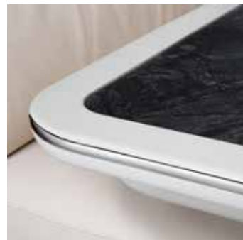
Tischplatte „Schiefer“ mit Randleiste in Vanille