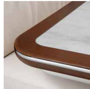
Tischplatte „Marmor“ mit Randleiste in Macadamia