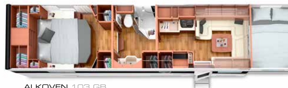
ALKOVEN 103 GB mit PKW-Garage