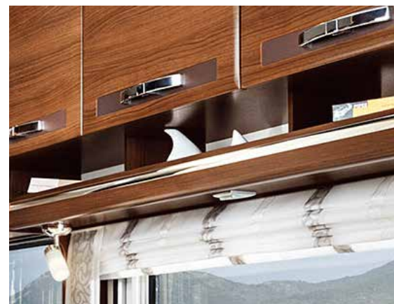
Unterschüge in Wohnwelt „Classic“