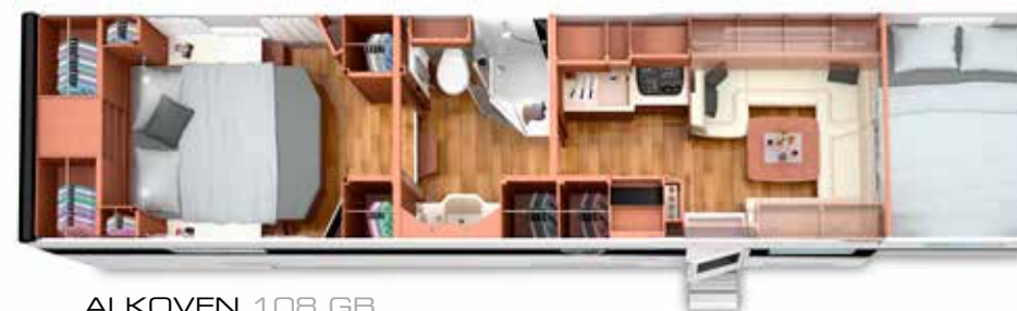
ALKOVEN 108 GB mit PKW-Garage