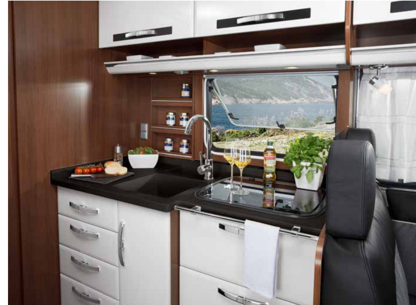
Küchenblock in Wohnwelt „Style“

Empfehlung: Fußboden: „Cappuccino“, Küchenarbeitsplatte: Mineralwerkstoff „Muskat“, Tischplatte: „Kupfer“, Polster: Leder „Nairobi“.