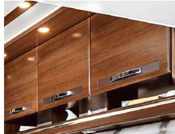
Oberschränke in Wohnwelt „Classic“