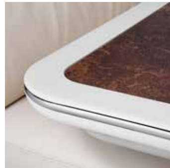
Tischplatte „Kupfer“ mit Randleiste in Vanille

Beim Wohnraumbüch haben Sie die Wahl zwischen drei verschiedenen Dekoren mit Randleisten entweder in „Vanille“ oder „Macadamia“ und strapazierfähigen, kratz- und empfindlichen Schichtstoffoberflächen. Die Arbeitsplatte in der Küche bietet drei Dekorvarianten und optional eine hochwertige Morelosan-Oberfläche. Spül- und Reste Becken sind nahtlos eingepasst, die Arbeitsplatte lässt sich so sehr leicht und komfortabel reinigen.