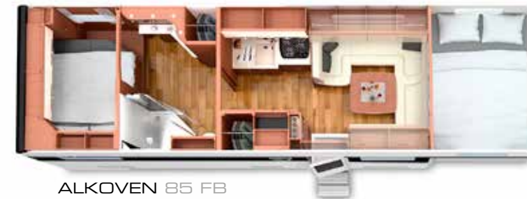
ALKOVEN 85 FB mit Rollergarage

Sechs Grundrisse, davon drei mit Rollergarage und drei mit PKW-Garage, dazu die Möglichkeiten der reichhaltigen Sonderausstattung, geben Ihnen die Freiheit der Wahl, den für Ihre Ansprüche und Bedürfnisse optimalen PALACE ALKOVEN zu finden.