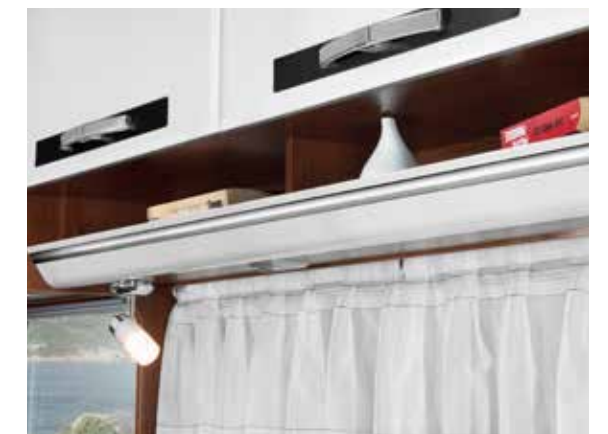
Unterschüge in Wohnwelt „Style“