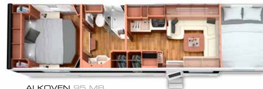
ALKOVEN 95 MB mit Rollergarage