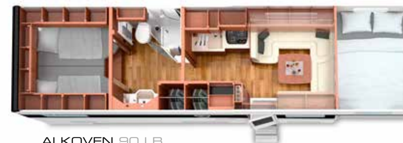
ALKOVEN 90 LB mit Rollergarage