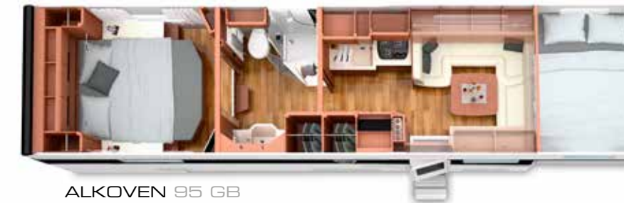
ALKOVEN 95 GB mit PKW-Garage