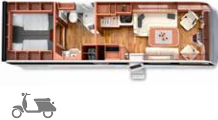
PALACE 88 LB